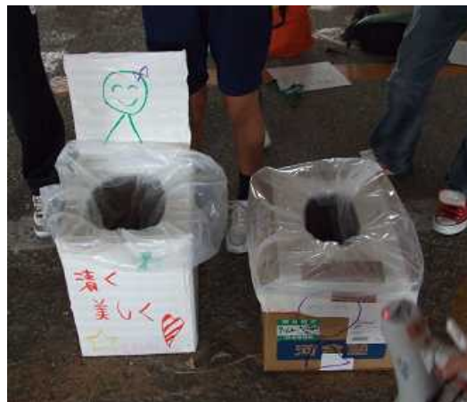
◆段ボールによる簡易トイレづくり