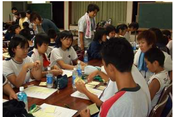
◆フェイスシートによる振り返り