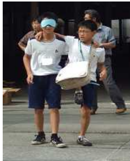
◆ 避難シミュレーションゲーム

災害は、ケガをして「困った」電気やガスが止まって「困った」タンスが倒れて「困った」と、日常生活ができなくなって「困る」ものである。従来の訓練は、場所から場所の移動であり、参加者が「困った」と感じる経験はほとんどない。この思考体験型防災訓練は、「体験」+「考える」という要素をとり入れ、訓練の参加者自身に被災生活の「困った」をよりリアルに想像してもらうものであ