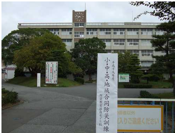
◆ 9/23 朝 城北高校正門