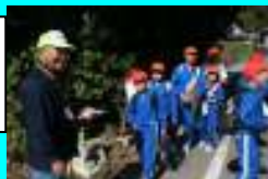
オリエン テリング 宮内小学校