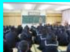
ゲスト ティーチャー