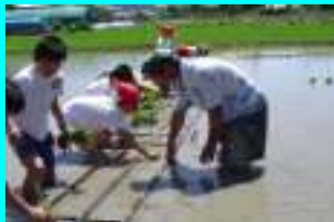
総合的な学習の時間 (田植え体験)