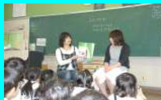
ボランティアによる読み聞かせ