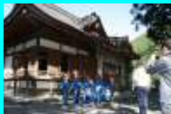
郷土学習 宮内小学校