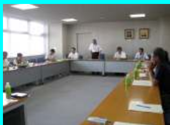
【実行委員会及び地域教育協議会】