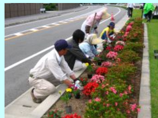
県道バイパスに花苗を植栽(阿南市桑野町)

「とくしま県民活動プラザ」の移動オフィスを開催(2回) アドプト団体による道路の植樹帯の植栽及び手入れ(南部花・はな募金事業) 限界集落の維持存続に向けた取り組みを進めるために地域支援センターに プロジェクトチームを設置 「わいわいkiki」、「伊座利cafe」など地域住民によるコミュニティ活動を実施 (美波町) 「縁結びの会」が男女の出逢いを仲立ちするイベントを 開催(4組ゴールイン 那賀町) 「丹生谷応援団」を結成(那賀町) 「美波みなとまちづくり協議会」による「100万人の キャンドルin日和佐川」(H21.12)等を実施