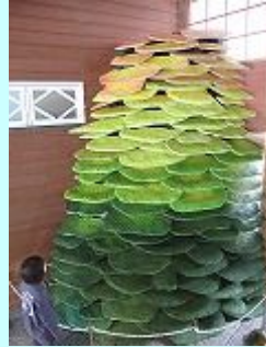
千年サンゴを守る取組