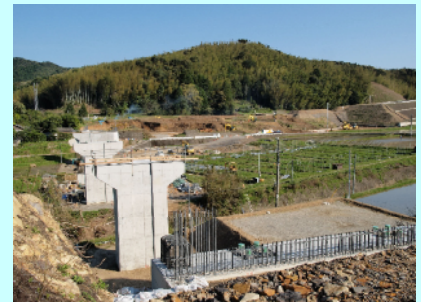
日和佐道路の工事促進