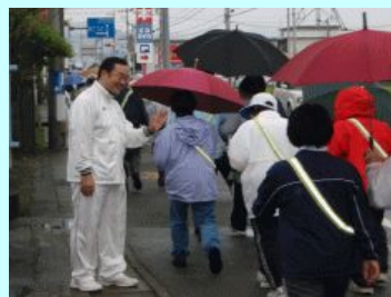
あなん健康増進ロードウォーキング

スクールガード活動等による幼児児童生徒の安全確保 県民局において消費者情報センターの相談員による相談 の実施(17回)