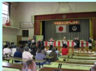
こどもたちとおじいちゃん、おばあちゃんの元気塾

「寄り合い防災講座」(26回)、「サテライト防災講座」(18回)の開催 観光事業者による「津波避難訓練」、高校生・地域住民を対象とした 「避難所体験訓練」の実施(各1回)