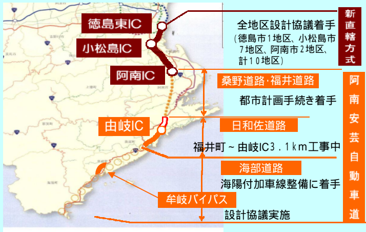
高速交通体系の整備計画