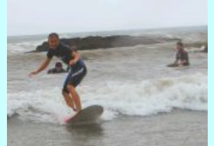
「南阿波よくばり体験推進 協議会」牟岐町内妻海岸