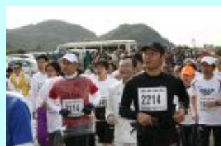
徳島・海陽 究極の清流 海部川風流マラソン