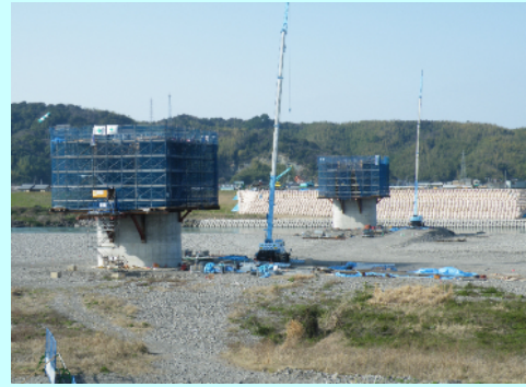
小松島IC～阿南IC(新那賀川橋工事H22.3)