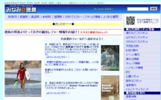
県南の魅力情報発信「みなみ@徳島」

「みなみ@徳島」のコンテンツの充実、情報発信の強化。 オンラインショップ運営講習会の開催(2回)