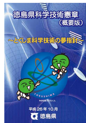
徳島県科学技術憲章

また、県立総合大学校において、広く県民にICTをはじめとした様々な知識習得の機会を提供している。