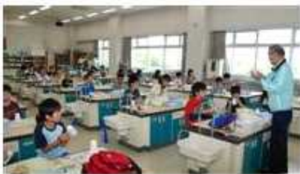
少年少女発明クラブ活動風景

学校教育の充実はもとより、理数分野に関するコンテストの実施等を通じて、子どもたちの科学知識の習得を図っている。