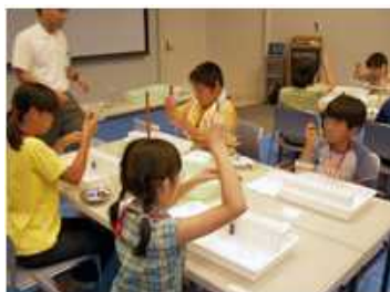
あすたむランド「キッズ科学教室」

「あすたむランド」における科学体験イベントや、企業や大学における就業体験や体験教育を通じて、低年齢児から