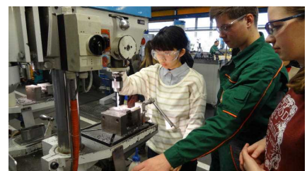
SSHの生徒による海外研修

県内3校(城南・徳島科学技術・脇町)のスーパーサイエンスハイスクール(SSH)を拠点校として、理数教育を推進し、将来の科学技術系人材を育成している。